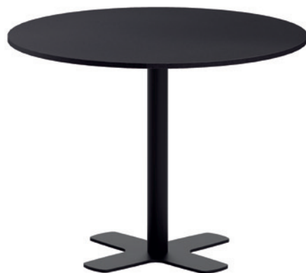
T Spinner FE ht75 100 ep79 HF00