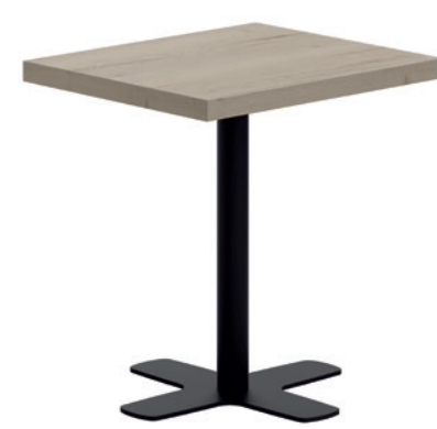
T Spinner-Q HA ht75 76 EP79 HA83