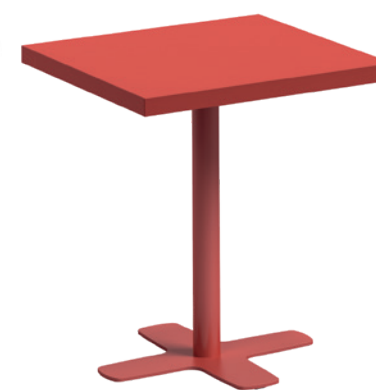
T Spinner-Q HPL ht75 77 ep39 HP39