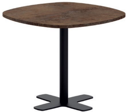
T Spinner HPL ht75 90C ep79 ...

Optional: T Spinner set 4 adjustable glides