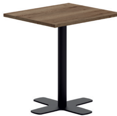
T Spinner HA ht75 76 ep79 HA85